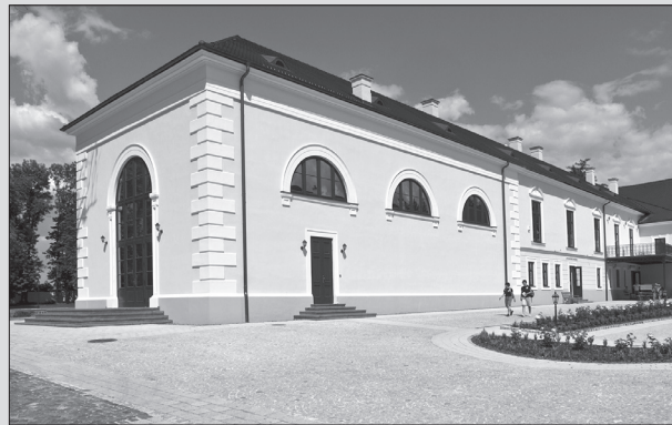
Kaštieľske krídlo s Apponziovskou knižnicou