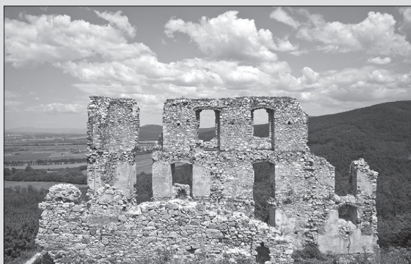
Oponický hrad je miestom s nádherným výhľadom.