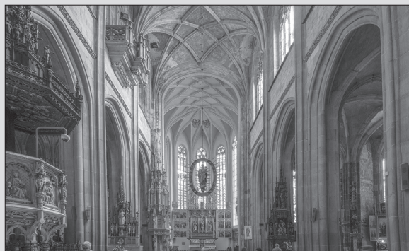
Interiér Dómu sv. Alžbety v Košiciach