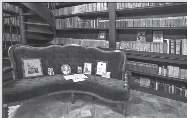
Predmety pripomínajúce albánsku kráľovnú Geraldinu