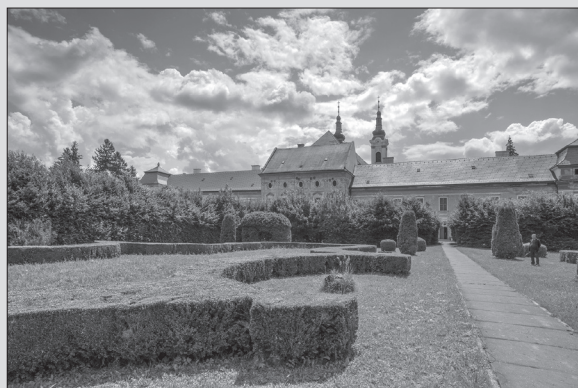
Baroková záhrada za kláštorom v Jasove