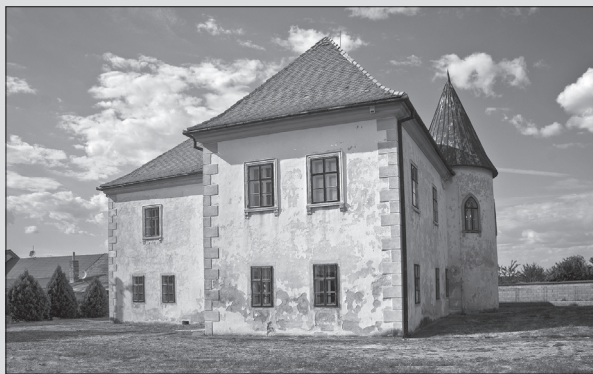
Malý kaštieľ v Oponiciach