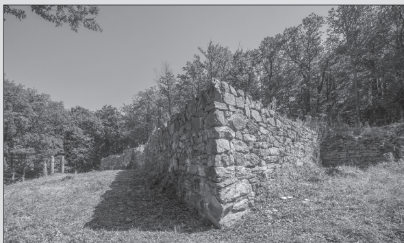
Zvyšky stredovekého hradu na Hradovej