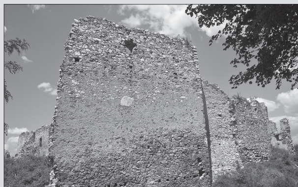
Ruiny Oponického hradu