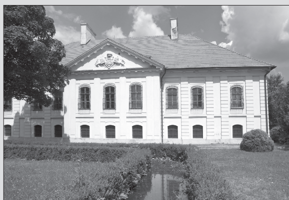
Veľký kaštieľ v Budimíre