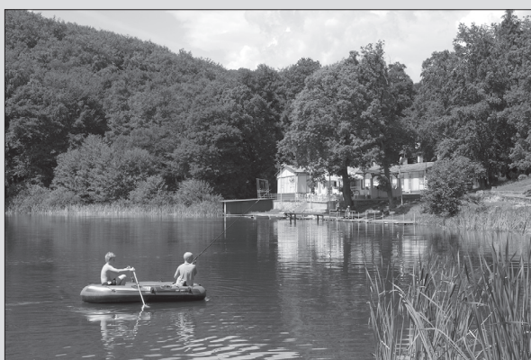
Jazero Izra v Slanských vrchoch