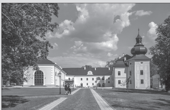
Veľký kaštieľ v Oponiciach