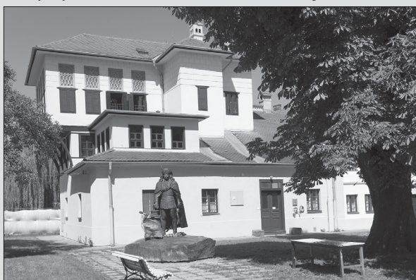
Dom Rodošto na nádvorí Katovej bašty v Košiciach