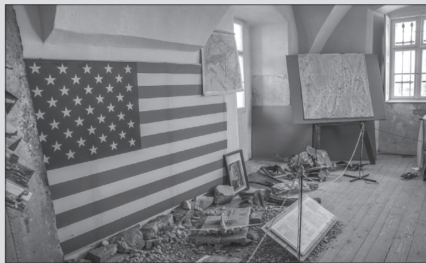
Expozícia v Malom kaštieli