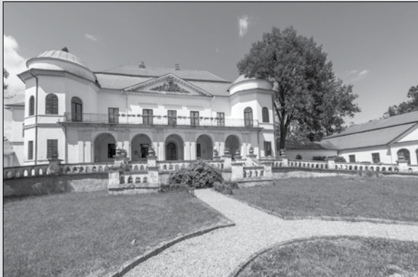
Kaštieľ v Michalovciach