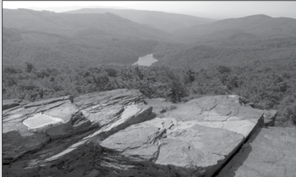
Morské oko zo Sninského kameňa