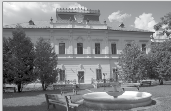
Kaštieľ v Pribeníku