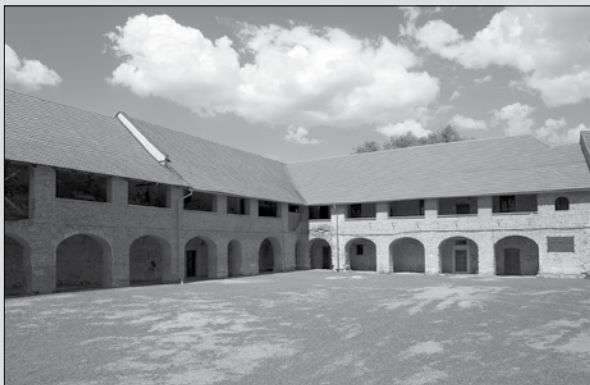
Kaštieľ v Borši