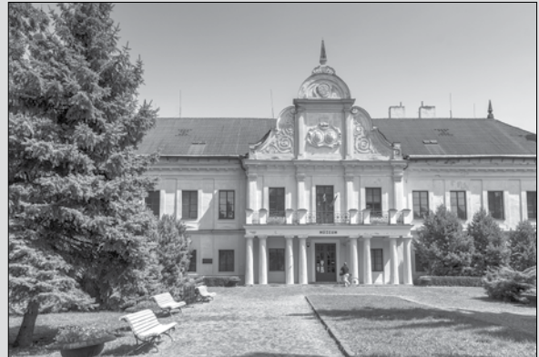
Kaštieľ v Trebišove