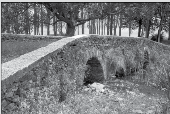
Most sv. Gotharda v Lelesi