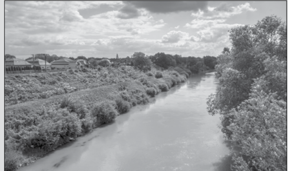
Rieka Uh pri Lekárovcich