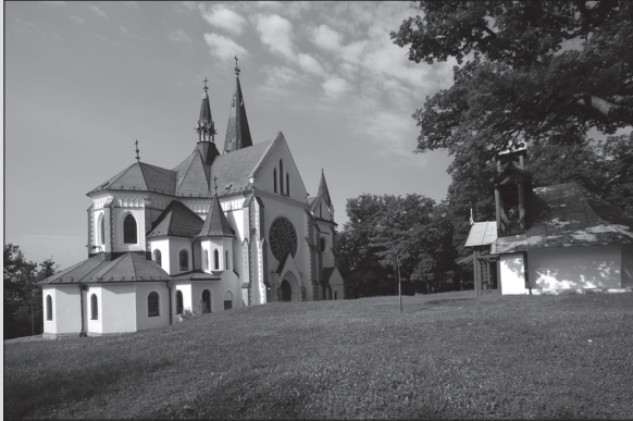
Levoča – Mariánska hora