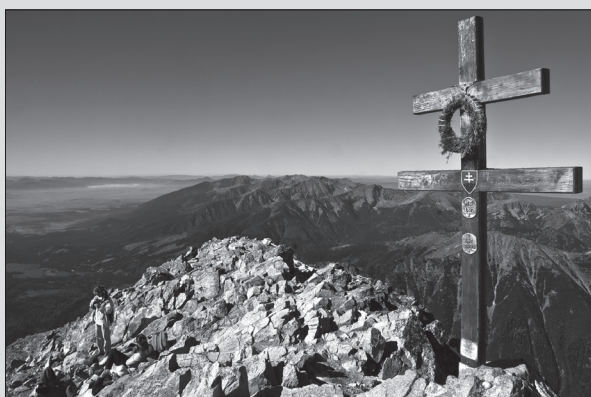
Na vrchole Kriváňa