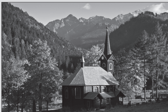
Kostol sv. Anny v Tatranskej Javorine