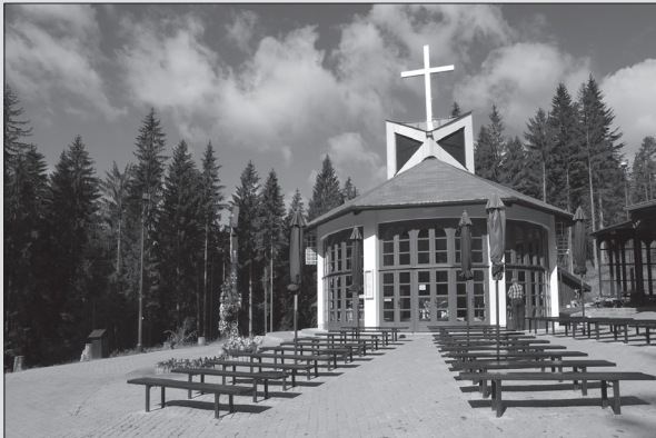
Turzovka – Živčákova