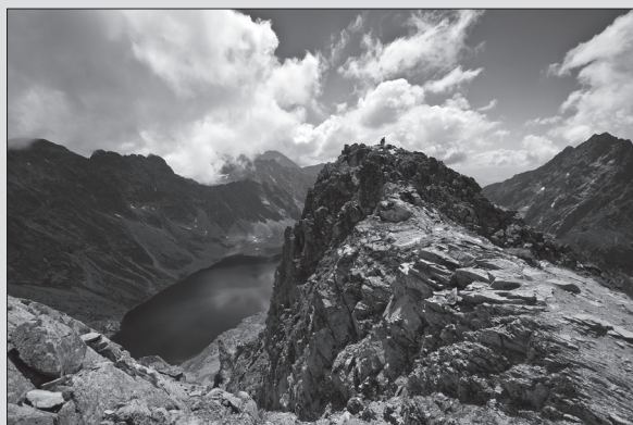
Veľké Hincovo pleso spod Kôprovského štítu