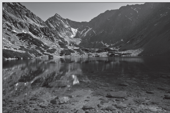
Nížne Temnosmrečinské pleso