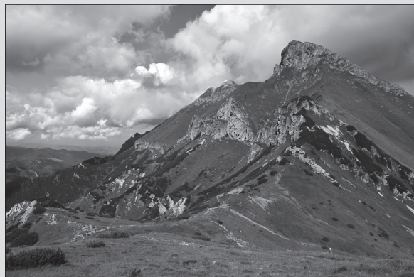
Široké sedlo v Belianskych Tatrách