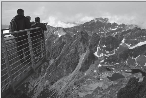
Na Lomnickom štíte