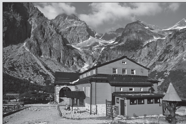
Chata pri Zelenom plese