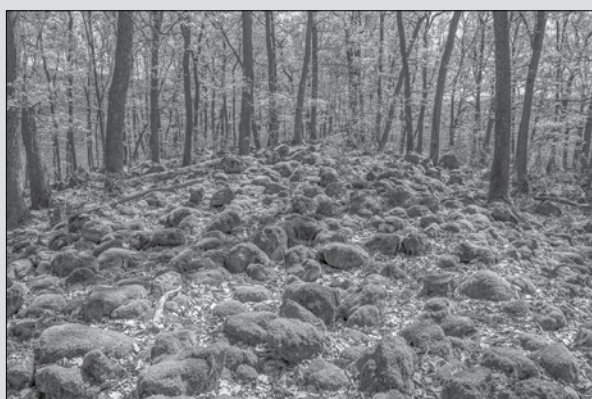
Spečený val pri Pečenicích