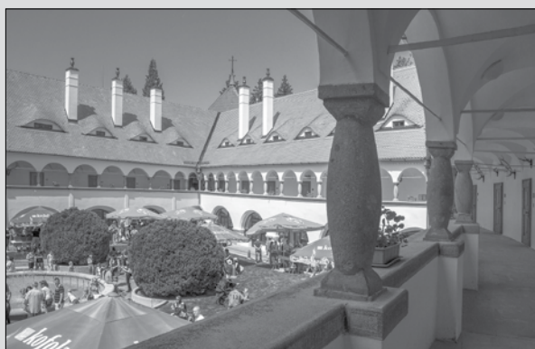
Kaštieľ v Topoľčiankach