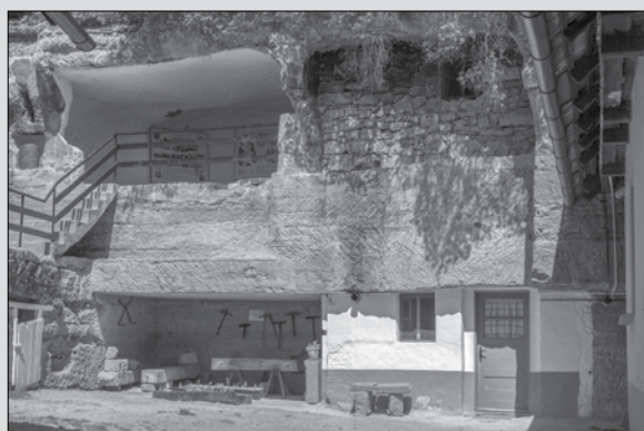
Skalné obydlia v Brhloviach