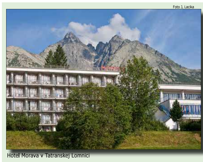
Hotel Morava v Tatranskej Lomnici

Na svahu pod Grandhotelom Praha je vybudovaná bobová dráha s dĺžkou takmer 500 m. Napravo od dráhy vedie turistický chodník označený zelenými značkami. Ním sa dostaneme do parku, ktorým preteká romantický potôčik. Trasa prechádzky pokračuje za Cestou slobody, ktorú prejdeme na križovatke pri hoteli Tulipán. Za hotelom sa objaví prie-