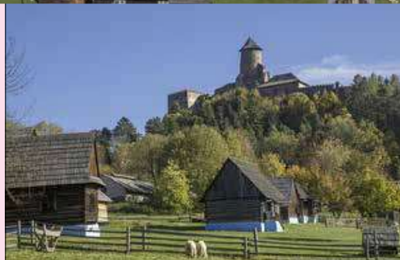
Ľubovniansky hrad zo skanzenu