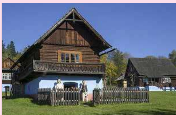
Národopisná expozícia Ľubovnianskeho múzea