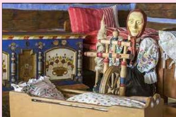
Interiér ľudového domu v skanzenu