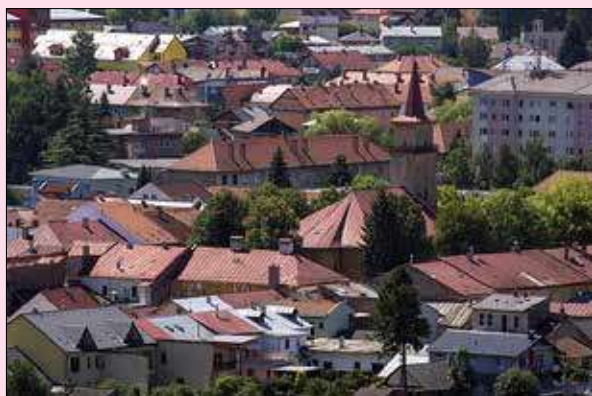
Centrum mesta s Kostolom sv. Mikuláša