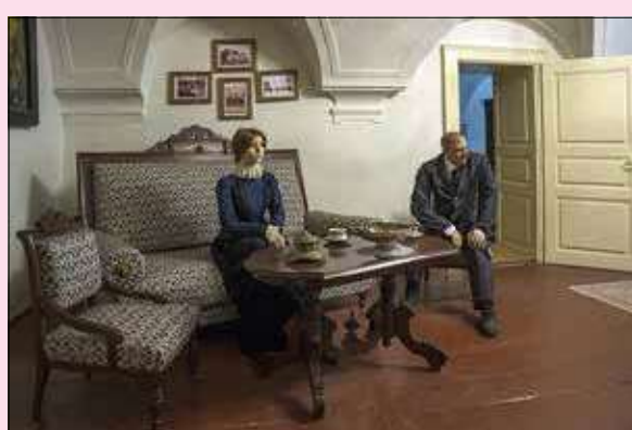
Expozícia v Dome Ľubovnianskeho mešťana