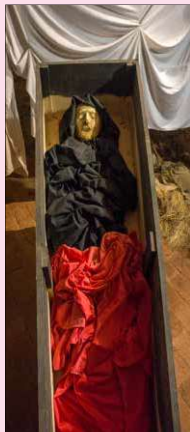
V temnom podzemí Domu Ľubovnianskeho mešťana