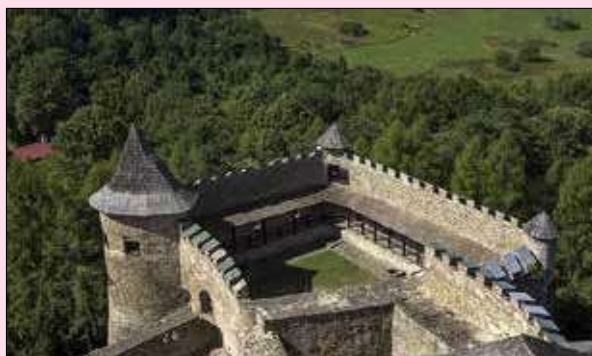
Výhľad z Ľubovnianskeho hradu