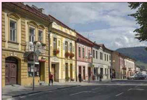
Historická zástavba Námestia sv. Mikuláša