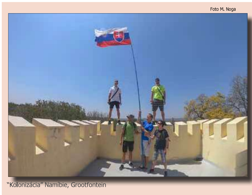
„Kolonizácia“ Namíbie, Grootfontein

Peace Parks Foundation, 2019. Peace Parks Foundation. [Online] 11 25, 2019. https://www.peace-parks.org/ .