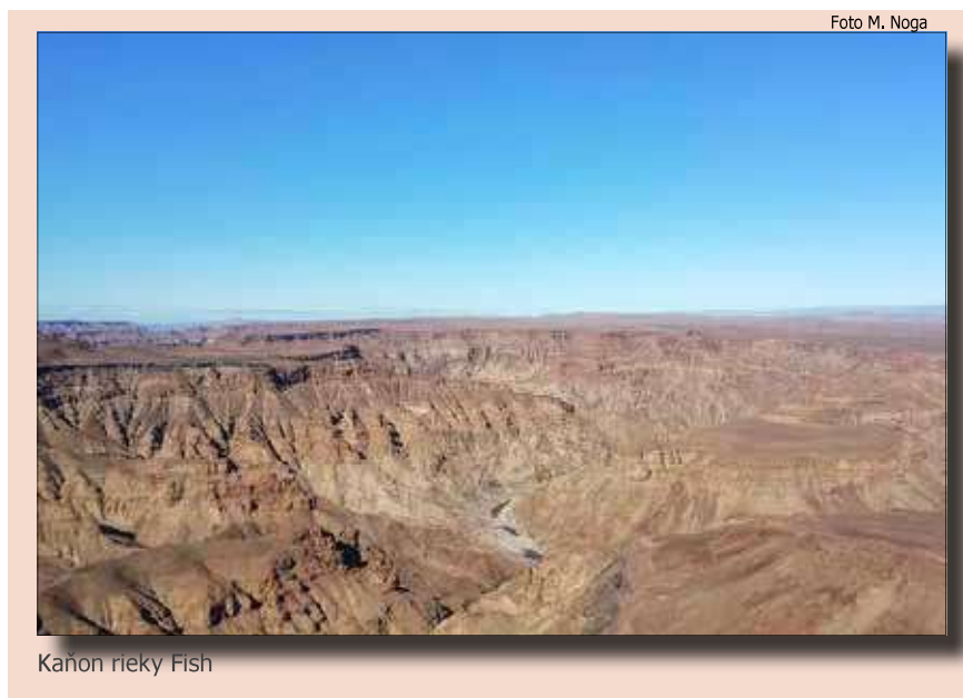
Kaňon rieky Fish

Na juhu Namíbie sa nachádza cezhraničný park /Ai-/Ais-Richtersveld, ktorý Namíbia zdieľa s Južnou Afrikou od roku 2003. Namíbijská časť NP /Ai-/Ais Hot Springs s rozlohou 4 611 km 2 predstavuje väčšiu časť cezhraničného parku. Hlavnými atrakciami sú Kaňon rieky Fish vo východnej časti parku. Kaňon je považovaný za druhý najväčší na svete po Veľkom kaňone v USA. Za 350 miliónov rokov bol kaňon vyhlbený najdlhšou riekou v krajine, riekou Fish. V najhlbšej časti dosahuje kaňon až 550 metrov a jeho dnom prechádza najobľúbenejší turistický chodník v Namíbií. V roku 1988 bola k parku pripojená západná časť s pohorím Huns. Pohorie je neprístupné pre motorové vozidlá a nevedie k nemu ani chodník. Nachádza sa tu však významná jaskyňa Apollo 11, v ktorej boli objavené rytiny pôvodných obyvateľov, ktoré sa datujú do obdobia