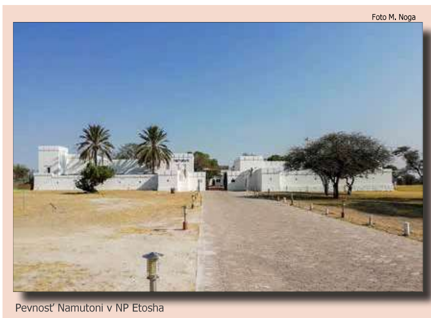
Pevnosť Namutoni v NP Etosha

Najmenším národným parkom v Namíbii je NP Cape Cross s rozlohou iba 60 km 2 . Oblasť „Križového mysu“ je pre krajinu významná z prírodného i kultúrneho hľadiska. Práve na toto miesto sa ako prvý Európan doplavil portugalský moreplavec Diego Cão v roku 1486. Kamenný križ, ktorý vztýčil na mieste vylodenia bol neskôr zničený a znovu vztýčený nemeckými kolonizátormi. Dnes tu stoja dva križe ako pamätníky moreplavca. V zálive pri myse sa nachádza najväčšia kolónia uškatka afroaustrálskeho na svete. Okrem obrovského počtu ohromí kolónia i intenzívnym rybáckim zápachom, ktorý je ťažko opísať. Dlhšia návšteva je vhodná iba pre ľudí so silným žalúdkom, nakoľko zápachu nezabránia ani rúšky. Po návšteve je vhodné vyprať oblečenie, ktoré ste mali oblečené, keďže i jeho vlákna pri návšteve napáchnu. Práve uškatke sú napriek intenzívnemu zápachu najväčším lákadlom v parku. V sezóne 2005/2006 si prišlo pozrieť kolóniu, ktorá v čase párenia predstavuje viac ako 200 tisíc jedincov, takmer 48 tisíc návštevníkov (MET 2010). Cape Cross sa nachádza približne 130 km severne od mesta Swakopmund. Prístup k parku vedie cez rozľahlejší Národný park Dorob a zároveň cez známe Pobrežie Kostier (Skeleton coast). Na pobreží boli naozaj objavené rôzne kostry, ale lákadlom pre turistov sú najmä stroskotané lode na plytkých neďaleko Namíbijského pobrežia.