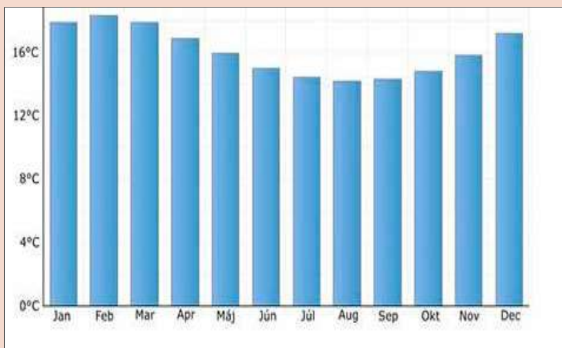
Priemerné hodnoty teploty vody počas roka, Swakopmund.

Obr. 6 Priemerná teplota vody v Swakopmunde počas roka