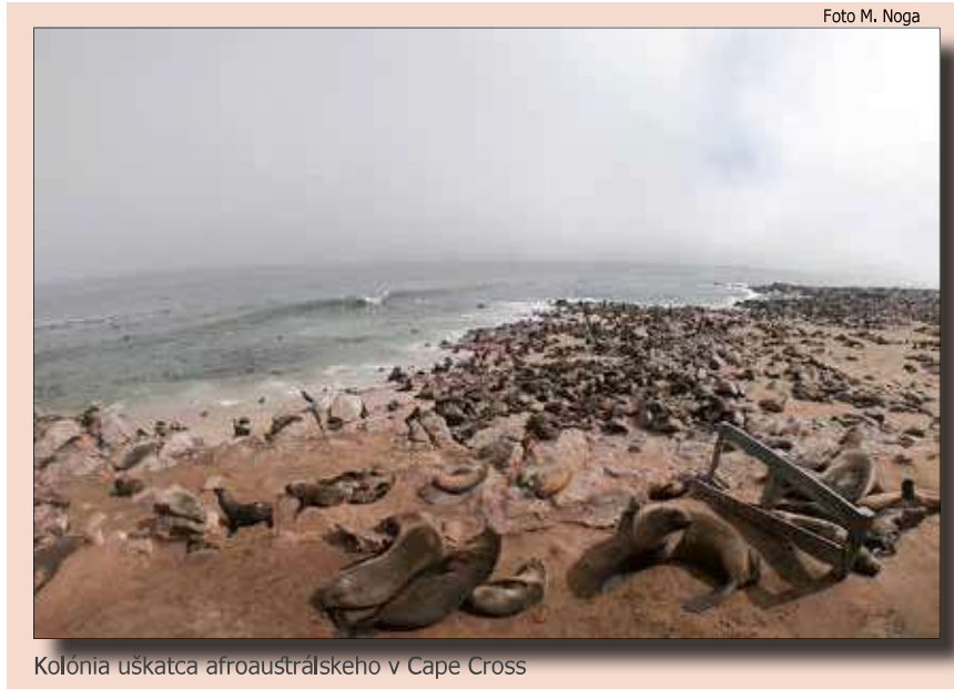
Kolónia uškatka afroaustrálskeho v Cape Cross

vetvami stromov. Farmy sú spravidla ohraničené drôteným plotom. Oplotenie fariem je často dlhé i niekoľko desiatok kilometrov. Zelené časti umelo zavlažovaných fariem pôsobia ako oázy uprostred prašnej krajiny centrálnej Namíbie. V údolí rieky Orange sa tiež nachádzajú súkromné vinohrady, ktoré tvoria rozsiahle pásy zelene, a ktoré výrazne kontrastujú s vnútrozemskou krajinou.