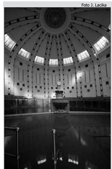
Zrkadlisko v Liečebni Irma

Popri reštaurácii s pozoruhodnými sgrafitami na fasáde sa dostaneme do Mestského parku s peknou piešťanskou tradíciou umiestňovania vý-