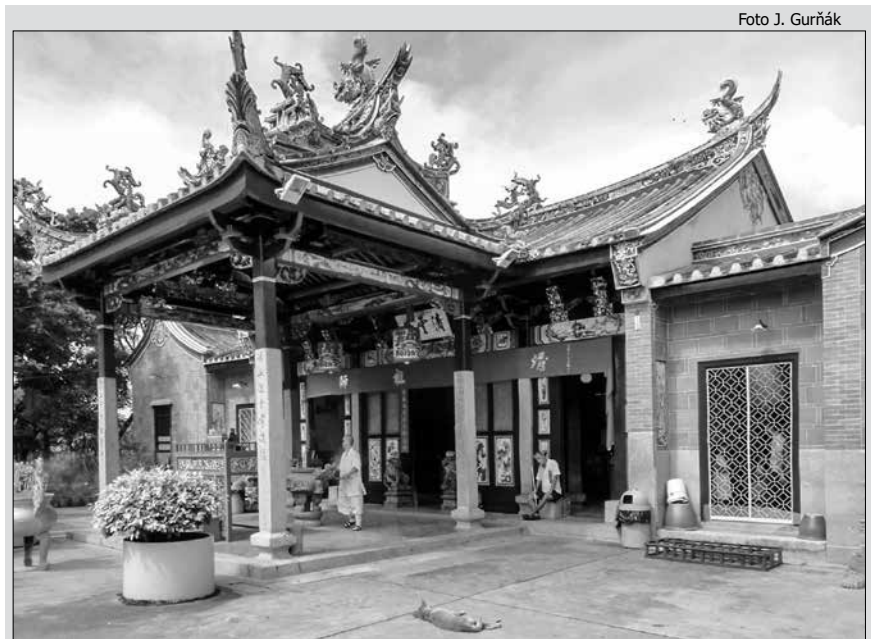
Čínsky hadí chrám na ostrove Penang v západnej Malajzii

Veľmi špecifické bolo postavenie etnických Číňanov v novovzniknutej Indonézii. Už od koloniálnych čias museli Číňania žiť v krajine oddelene od domáceho obyvateľstva vo vlastných štvrtiach. Vážnejšie problémy začali počas indonézskej vojny za nezávislosť (1946-1949), ktorá mala na mnohých miestach aj charakter občianskej vojny, etnických a náboženských čistiek, kedy boli Číňania vyvražďovaní za svoju vieru a boli násilne nútení k prestupu na islam. Napriek všetkým týmto okolnostiam, migrácia do Indonézie naďalej pretrvávala a z dôvodu občianskej vojny v Číne dokonca zosilnela (WILLMOTT 2009). Príťaž pre novozaloženú Indonéziu po získaní nezávislosti v roku 1949 predstavovala evidencia čínskej menšiny ako cudzincov, ktorá bolo zaužívaná už od dôb holandskej nadvlády (WALU-