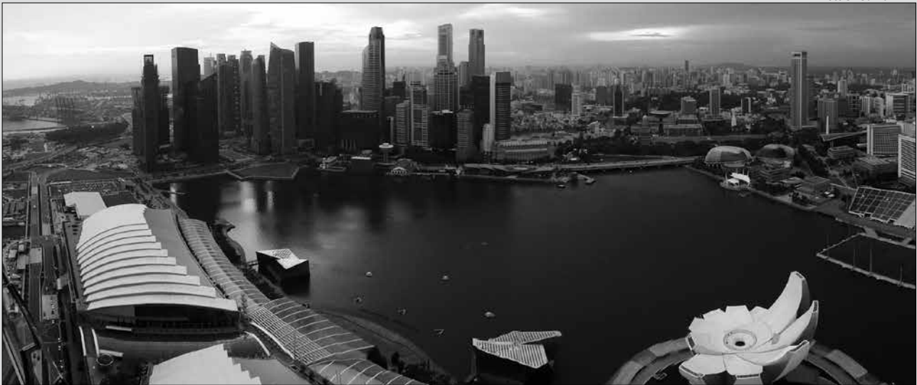
V modernom Singapore tvoria Číňania väčšinu obyvateľov.

nesprávne predpokladať, že singapurská vláda nikdy nemala v úmysle integrovať multietnický Singapur, avšak z pôvodného cieľa na vytvorenie jednotného singapurského národa pomocou reetnizácie prešla na vytvorenie národnej identity pomocou občianstva založeného na spoločných hodnotách (SURYADINATA 2007).