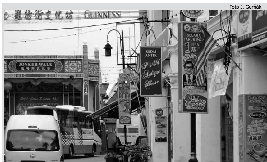
Čínska štvrť v Melake – všadeprítomné čínske reklamy a pútače vypovedajú o obchodnom duchu miestnych Číňanov.

Krajiny juhovýchodnej Ázie majú veľmi špecifické postoje a stratégie vzťahujúce sa k riešeniu problematiky etnických a náboženských menšín. Napríklad v Thajsku sa vláda už od 19. storočia snaží vybudovať silnú národnú identitu, v dôsledku čoho boli najmä v minulosti rozličné etnické skupiny, čínske etnikum nevyvímajúc, značne asimilované do thajskej spoločnosti. Podobný osud postihol čínske etnikum aj na Filipínach. V Malajzii a Indonézii sa čínska situácia vyvinula inak. V oboch krajinách bolo čínske etnikum výrazne poznačené separáciou a následnou diskrimináciou (TONG 2010). Táto diskriminácia sa začala prejavovať už v 16. storočí, v dobe vznikajúceho kolonializmu, kedy začali byť Číňania domorodým obyvateľstvom vnímaní čoraz negatívnejšie, a to najmä z obavy pred rastúcim čínskym vplyvom nadobudnutým pomocou vynikajúcich obchodníckych schopností