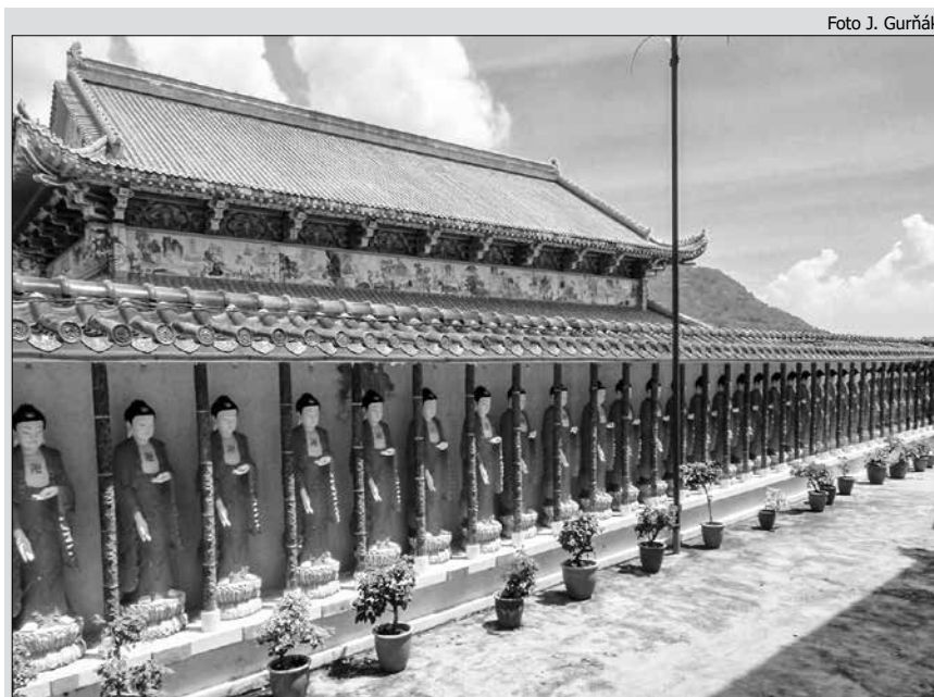
Khoo Kongsi v centre Georgetownu – sídlo a chrám čínskeho obchodného klanu

Počet približne jeden milión osôb dosahujú aj čínske komunity v ďalších troch krajinách juhovýchodnej Ázie. Konkrétne na Filipínach, v Mjanmarsku a vo Vietname. Na Filipínach žilo v roku 2011 asi 1,24 mil. Číňanov a tvorili 1,3 % populácie (POSTON a WONG 2016). Čínska menšina v krajine je omnoho menej početná ako v Indonézii alebo Malajzii, ale aj napriek tomu si udržiava pomerne značnú homogenitu. V Mjanmarsku tvorili Číňania 1,7 % populácie s počtom 1,05 mil. osôb v roku 2011 (POSTON a WONG 2016), pri-