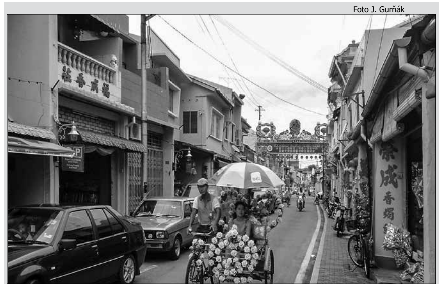
Čínsku štvrť v Melake stále symbolicky vymedzuje vstupná brána.

Podoby prispôsobovania sa etnických Číňanov na miestne podmienky sa menili v čase a priestore. Na začiatkoch diaspóry, keď čínska menšina nedosahovala veľké počty a migrovali najmä muži, prebiehal zväčša iba proces asimilácie. Avšak nárastom počtu migrujúcich v 19. storočí bolo toto etnikum schopné vytvárať komunity, vďaka čomu si zachovávalo tradičné prvky svojej kultúry. Takýmto spôsobom prebiehal proces formovania čínskeho etnika najmä v Malajzii. Naopak, v Thajsku boli Číňania podrobení výraznej asimilácii až do konca 20. storočia. Môžeme zovšeobecniť, že do 19. storočia sa čínske etnikum asimilovalo do spoločnosti najmä vďaka sobášom s miestnymi ženami, a to v dôsledku absencie čínskych žien. Tento