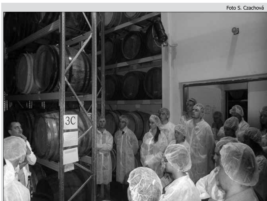
Vo vinárskom podniku Hubert J. E. v Sereďi

Výroba koží má na Liptove dlhú, viac ako 370 ročnú tradíciu. Po páde režimu sa celý kožiarsky priemysel v bývalom Československu zrútil. V roku 2005 bola založená firma SlovTan Contract Tannery.