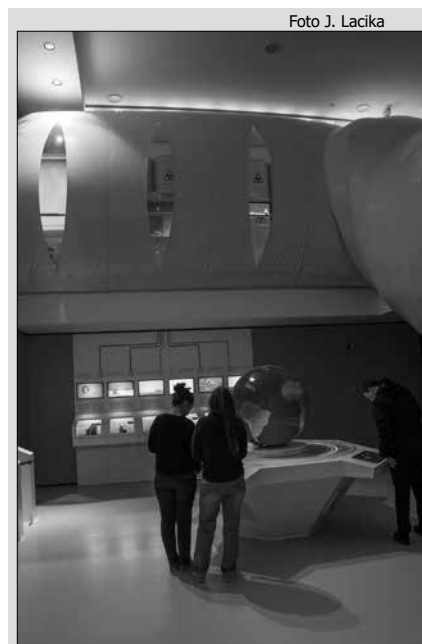
Energoland – interaktívne centrum v JE Mochovce

Spoločnosť ECCO sa zaoberá výrobou luxusnej vychádzkovej pánskej, dámskej, ale aj detskej obuvi z kože. Spoločnosť bola založená v Dánsku v roku 1963. Ecco Slovakia vznikla v roku 1998. Bola jednou z prvých dánskych investícií na Slovensku, pričom išlo o tzv. investíciu na zelenej lúke. V súčasnosti zamestnáva takmer 900 ľudí. Prakticky celá produkcia firmy ide na vývoz, hlavne do Škandinávie, Nemecka, USA, Ruska a na Ukrajinu. Exkurzia v podniku sa začína stručnou prezentáciou celej spoločnosti - jej históriou,