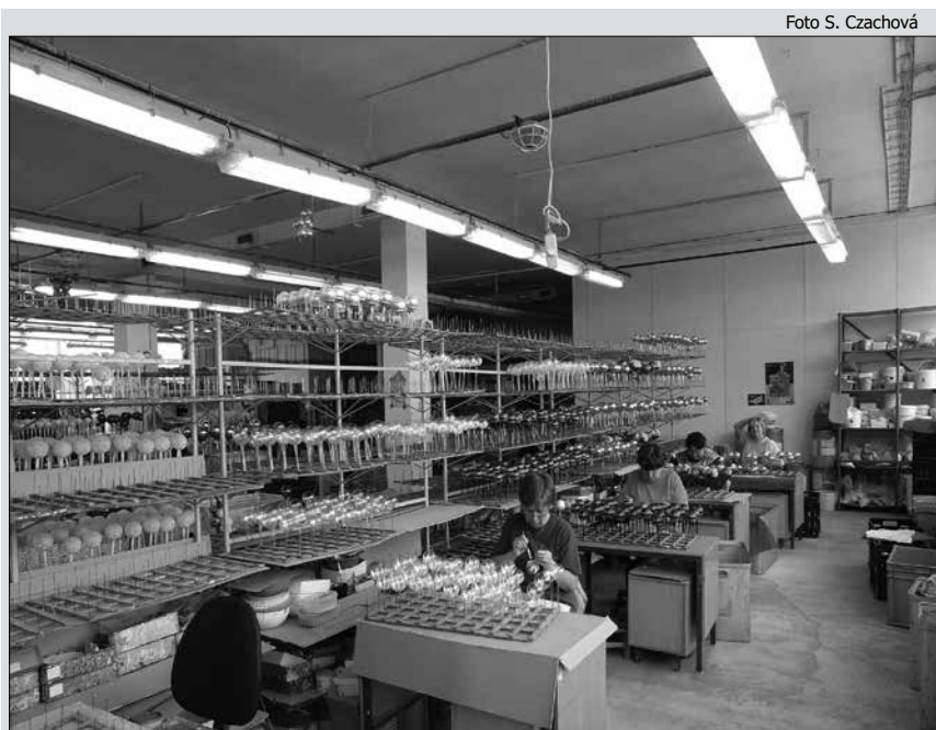
Exkurzia v podniku Okrasa v Čadci vyrábajúcom vianočné ozdoby

Exkurzia ako organizačná forma vyučovania, ktorá je neoddeliteľnou súčasťou geografického vzdelávania, je u žiakov obľúbená, pretože predstavuje vyučovanie mimo školského prostredia. Poznanie sprostredkované zrakom, sluchom, hmatom či čuchom je vždy hodnotnejšie a trvalejšie ako sprostredkované učebnicou (BASHA 2004, in ČIPKOVÁ a kol. 2015). Najjednoduchšou exkurziou je exkurzia typu „look and see“ (prekl. pozeráť a vidieť), ktorá umožňuje žiakom poznať miesta, ktoré sa nedajú imitovať v triede. Podľa LAMBERTA a BALDERSTONA (2010, s. 279) exkurzie ovplyvňujú život žiakov a menia ich po-