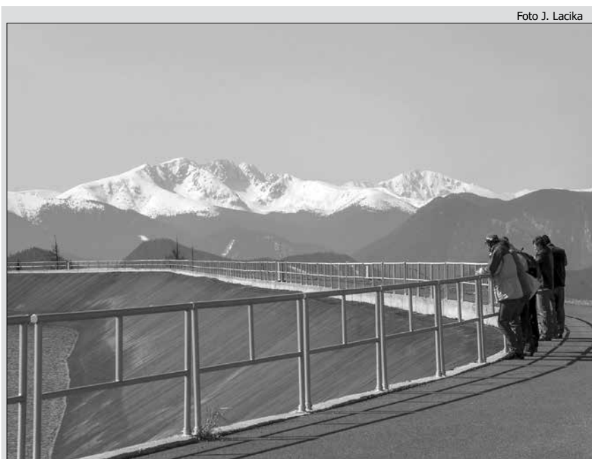
Horná nádrž Vodného diela Čierny Váh

Odvetvová a priestorová štruktúra výrobných hospodárskych činností na Slovensku sa za ostatné pol storočie výrazne zmenila. Výrobné sektory hospodárstva (poľnohospodárstvo a priemysel) zaznamenali pri prechode z centrálne plánovanej ekonomiky k trhovej ekonomike výrazné zmeny. Poľnohospodárstvo sa transformovalo, čoho dôsledkom bola zmena štruktúry využívania poľnohospodárskej pôdy, zníženie stavu hospodárskych zvierat a vplyv vstupu krajiny do Európskej únie prijatím spoločnej poľnohospodárskej politiky. V priemysle došlo v sledovanom období k výraznému poklesu počtu zamestnaných v priemysle a k zmene priestorovej a odvetvovej štruktúry. Z priestorového hľadiska sa prehĺbili rozdiely medzi západným Slovenskom a zvyšným územím Slovenska, k čomu prispelo predovšetkým smerovanie zahraničných investícií. Z odvetvového hľadiska sa motorom slovenského priemyslu stali automobilový a elektrotechnický priemysel.